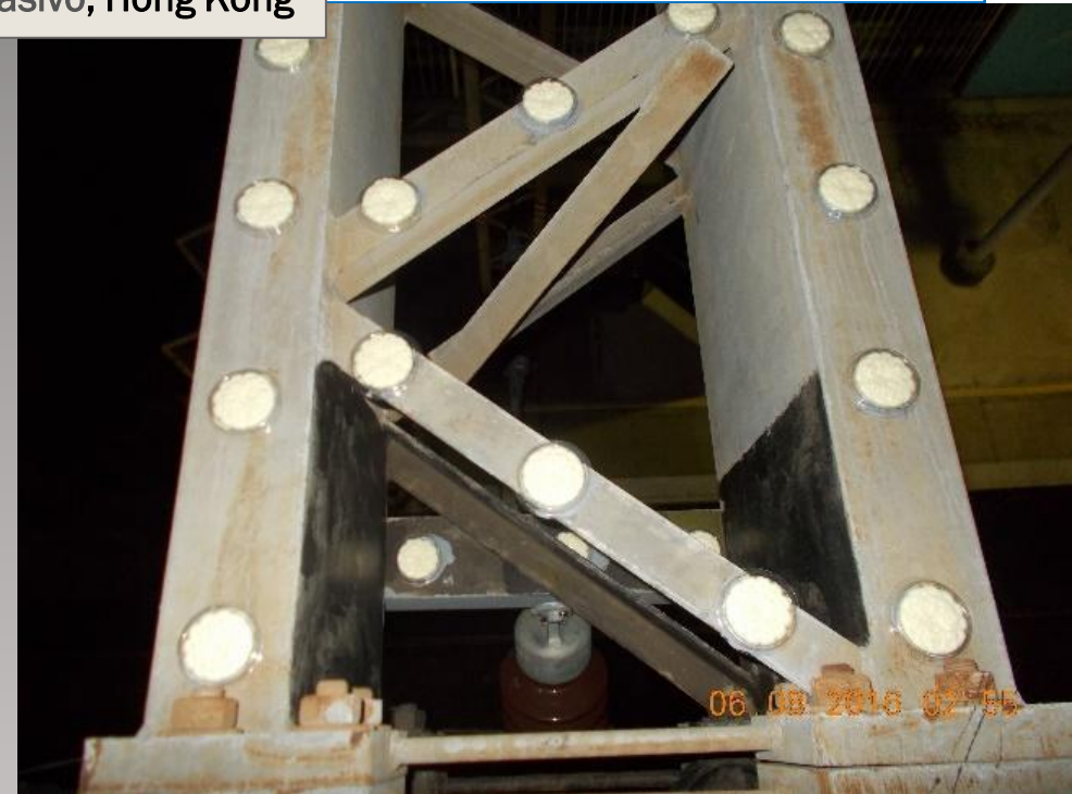
2 Bird Free aplicado al pórtico, agosto de 2016