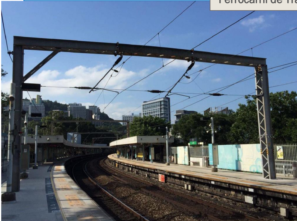
1 Pórtico de catenaria con nidos