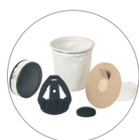
Grupo de filtros