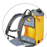
Arnés anatómica porta-accesorios cómoda