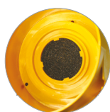
Filtro de protección del motor adicional