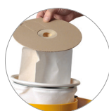
Bolsa de filtro de fieltro y filtro de tela