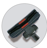
Boquilla para suelos polvo con ruedas RD 285