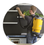
Ligero y práctico